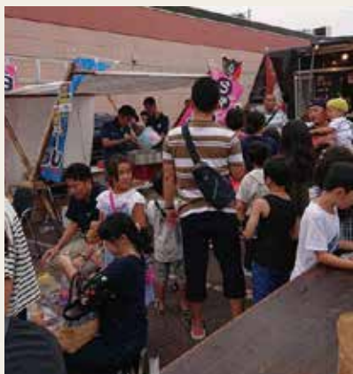
TOMOSフェス 青年部ブース

すっかり地域に定着した夏祭りの一つです。今年は、スギタバーカー駐車場にて、ボールすくい・ヨーヨー釣り・花綿あめを出店しました。地域の子供達に喜んでもらえるコーナーとして大盛況でした。