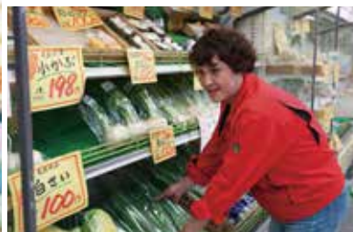
店内所狭しと並ぶ艶々とした野菜たち