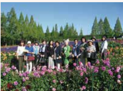
世羅高原ファーム ダリア畑

10月9日(水)、マリンバイオセンター、世羅高原ファーム、ステーキ懐石都春日(昼食)へ行きました。天候にも恵まれ、親睦を深めた1日でした。