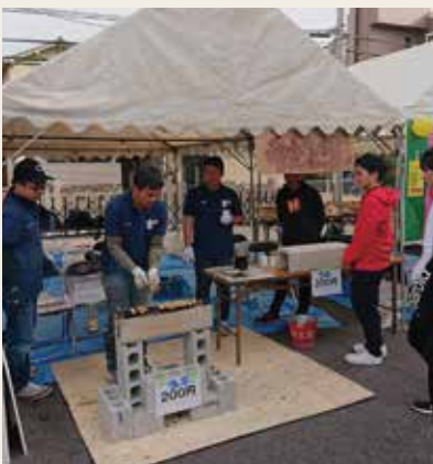
興動祭 青年部ブース

広島経済大学興動館主催「第十四回祇園興動祭」が開催されました。青年部の出店は、花綿あめ・やきとりを出店しました。当日は学生と良いコミュニケーションが図かれ大変有意義でした。