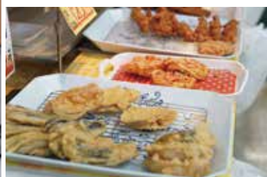
人気の揚げ物はお昼と夕方に揚げたてが並ぶ