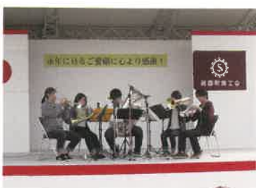
広島文化学園大学金管五重奏