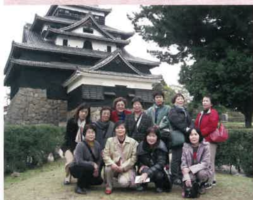
国宝「松江城」天守閣前にて