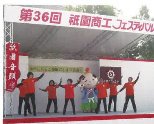
ニューぎおん音頭