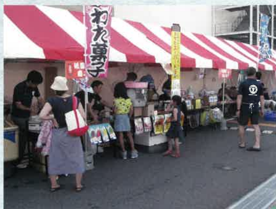
イオンモール祇園町夏祭り青年部ブース

●日時／8月11日～12日 ●場所／イオンモール広島祇園店 ●参加者／15人 すっかり恒例となり、夏の風物詩として地域に定着した夏祭りのひとつです。今年は駐車場で青年部ブースを出店しました。 「ボールすくい・光りもの・くじ・かき氷・綿菓子・ビール」 地域の子供たちが喜んでくれるコーナーとして大盛況でした。