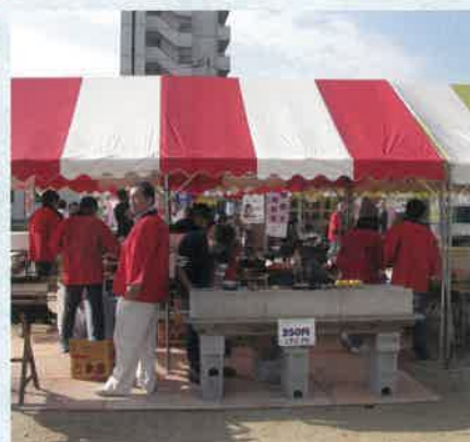
祇園商工フェスティバル青年部ブース

●日時／8月11日～12日 ●場所／イオンモール広島祇園店 ●参加者／15人 すっかり恒例となり、夏の風物詩として地域に定着した夏祭りのひとつです。今年は駐車場で青年部ブースを出店しました。 「ボールすくい・光りもの・くじ・かき氷・綿菓子・ビール」 地域の子供たちが喜んでくれるコーナーとして大盛況でした。